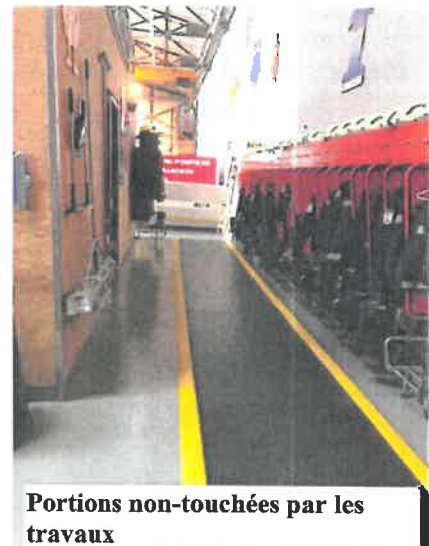
Portions non-touchées par les travaux

A la demande du SDIS, des entreprises ont été contactées pour établir une offre de réfection. Bien que l'ensemble de la surface soit touchée par ce vieillissement prématuré, des interventions ponctuelles sur certaines portions de la surface sont prévues, à savoir le garage principal. En effet, il semble compliqué et coûteux de réaliser une réfection sur les 858 m 2 occupés. Ainsi, une surface de 538 m 2 sera renouvelée et sécurisée par un revêtement plus résistant aux passages fréquents et moins glissant. Certains locaux comportent des aménagements lourds (vestiaires notamment), que le SDIS n'a pas prévu de rénover. Des tapis de caoutchouc y ont été installés de longue date, limitant ainsi le risque de chutes.