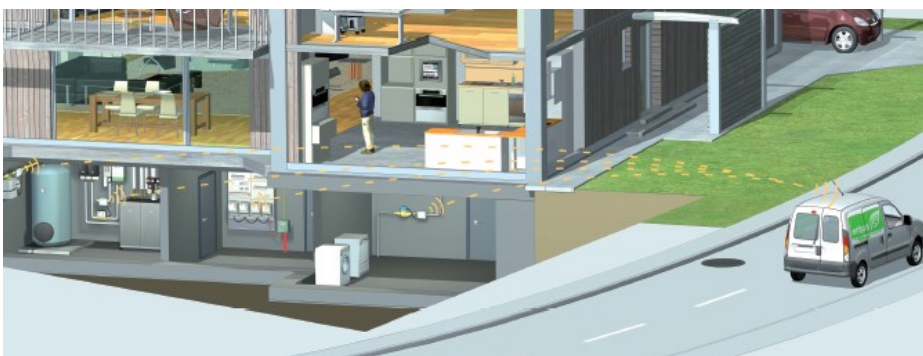
Relevé radio « drive by »

Nous vous remercions par avance de l'accueil que vous réserverez à nos concessionnaires. En cas de problème ou question, n'hésitez pas à contacter l'administration communale qui vous guidera vers les personnes compétentes.