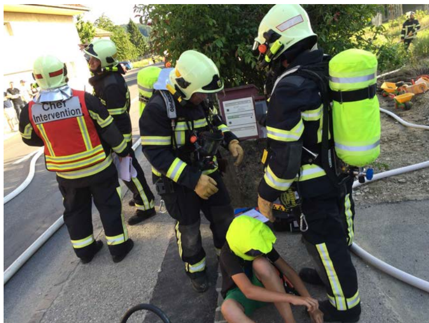
Exercice d'intervention du DPS Yvonand

Plus d'informations sur www.sdisnv.ch ou en écrivant à info@sdisnv.ch .