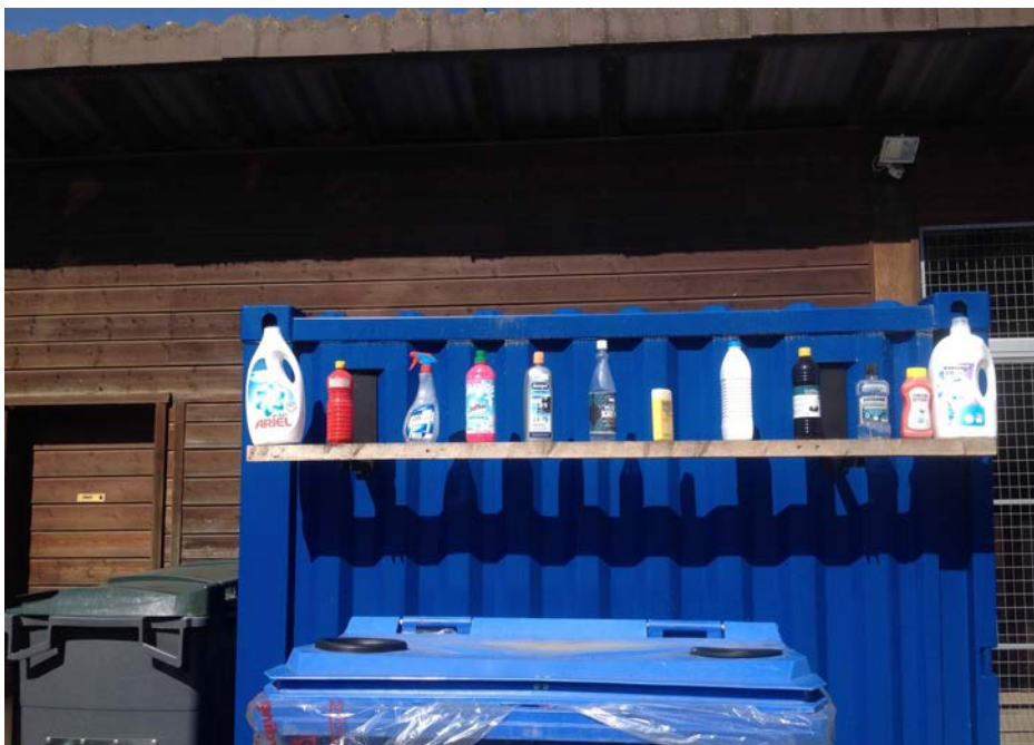
Le tri des plastiques aux Vursys et ce qu'ils deviennent chez RC-Plast (ci-dessous)

La Municipalité a décidé de valider définitivement la collecte séparée des plastiques à Yvonand.