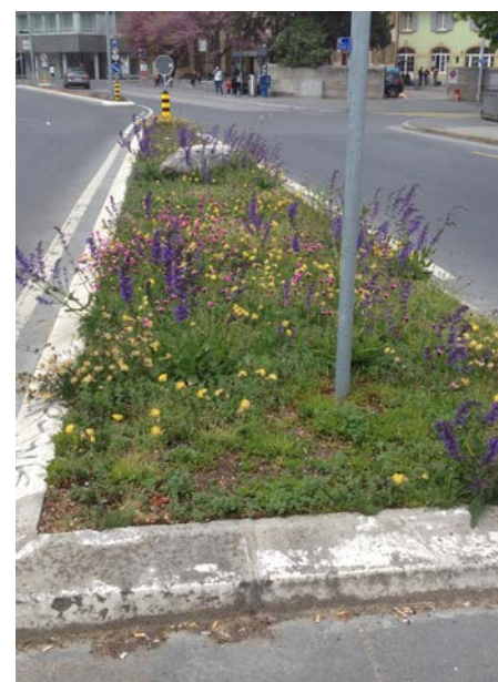
Exemples de prairies fleuries d'aménagements routiers à Yverdon-les-Bains