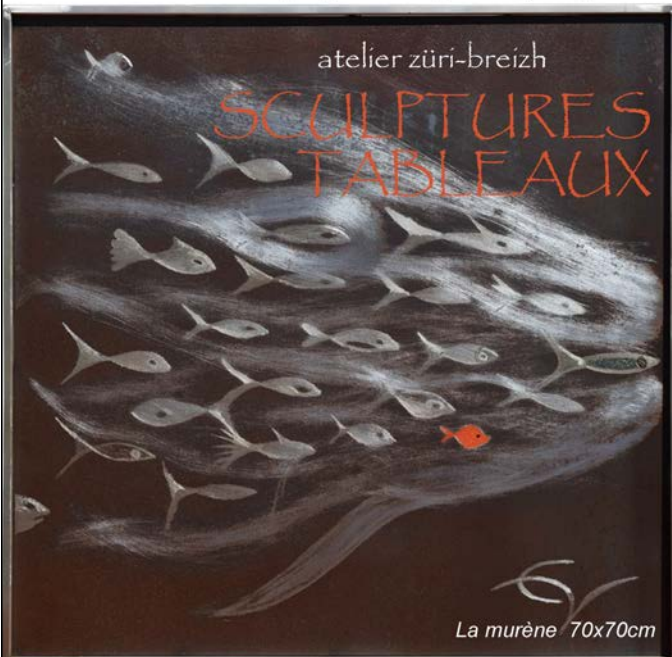
La murène 70x70cm

Gravures sur métal oxydé, taille de pierres, sculptures