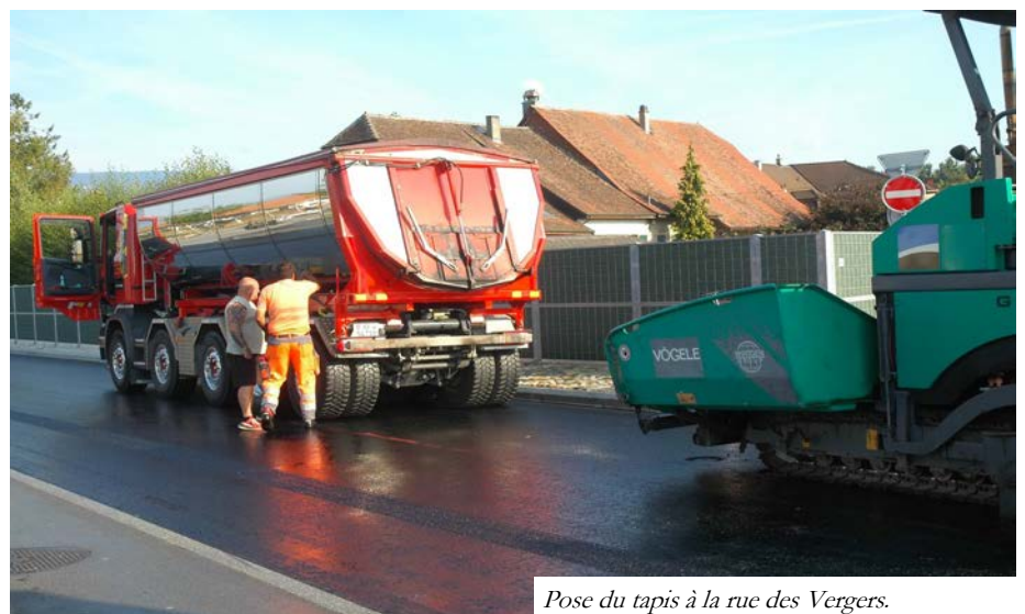
Pose du tapis à la rue des Vergers.

Ce revêtement spécial, appelé phono-absorbant par les spécialistes, demandait d'être posé en une seule fois. Les routes concernées ont été ainsi fermées totalement à la circulation sur deux week-end afin de minimiser l'impact.