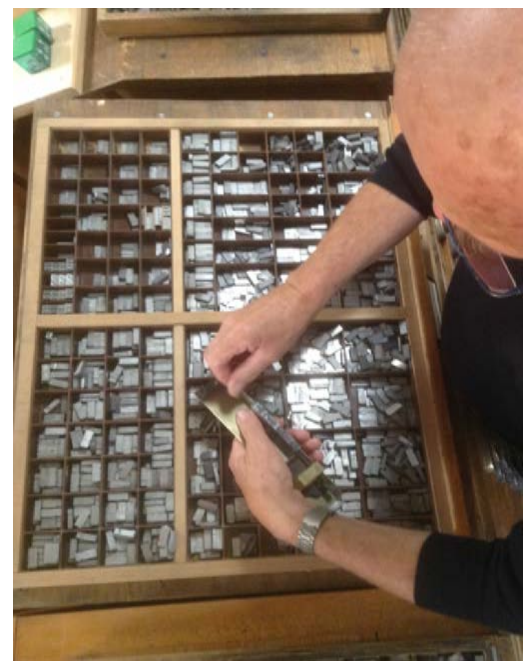
L'atelier de composition de l'Espace Gutenberg et le compositeur au travail devant une casse avec son composteur