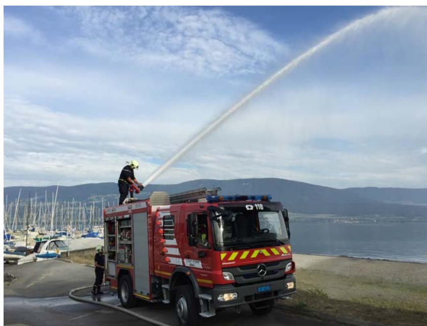
Exercice de permanence DPS Yvonand