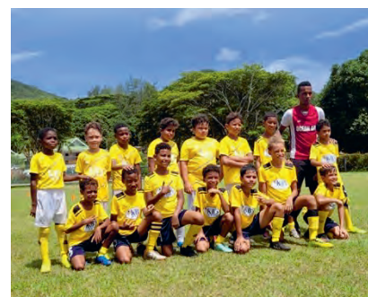
L'équipe actuelle, presque au complet