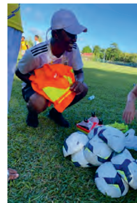
Le matériel reçu