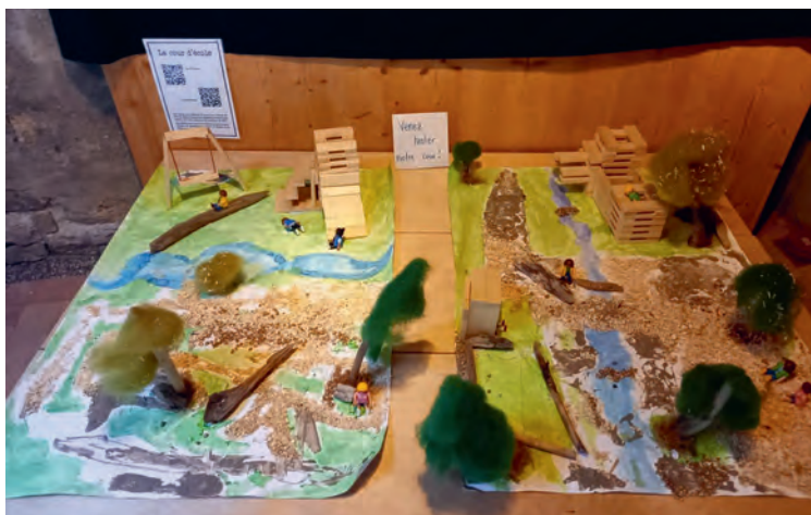
Maquette de la cour idéale

Notre travail a fait l'objet d'une exposition au centre de Champ-Pittet à laquelle ont aussi participé deux classes d'Yverdon.