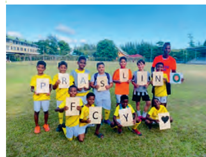
L'équipe il y a un an