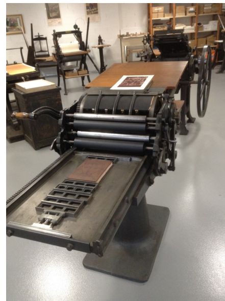
La presse à épreuve danoise