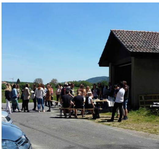
Inauguration du local-dépôt de la Jeunesse

Le même jour, le FC Yvonand retrouvait l'herbe de son terrain en Brit. Après les lourds travaux de renforcement du terrain réalisés en automne, il fallait attendre que l'herbe ait suffisamment repoussé pour y poser à nouveau des crampons. Des horaires dicteront désormais de manière plus stricte son utilisation.