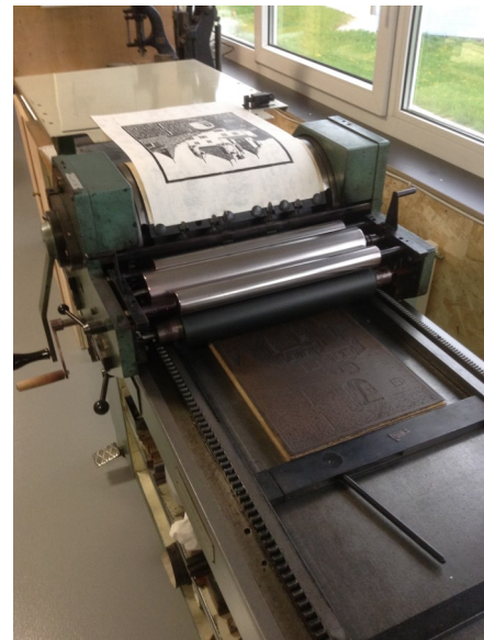
La presse à épreuve FAG