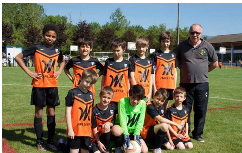
Les juniors E2 heureux de retrouver leur terrain