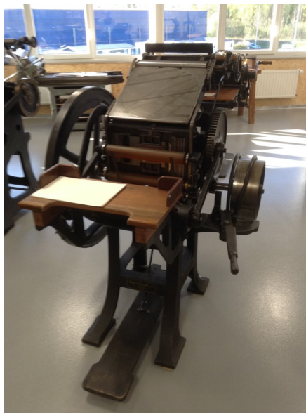
La presse à platine Winkler

A l'occasion de l'inauguration du bâtiment communal de la petite Amérique, l'Espace Gutenberg ouvre ses portes au public le samedi 18 juin de 9 h. à 13 h.