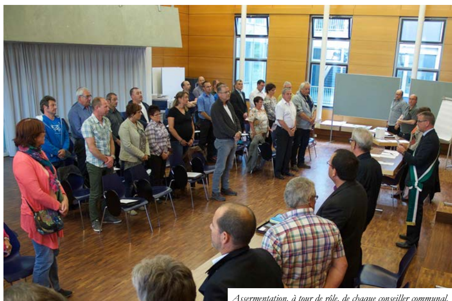
Assermentation, à tour de rôle, de chaque conseiller communal.