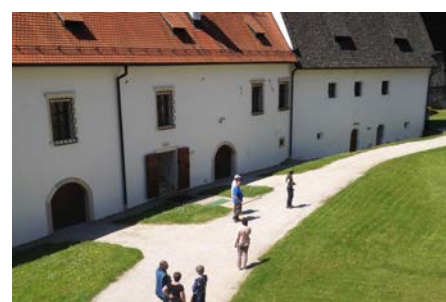
Vue sur la vieille ville de Ljubljana et Chartreuse de Zice