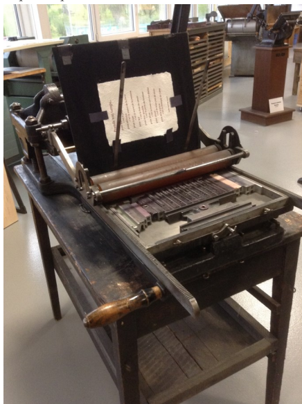
La presse à platine horizontale