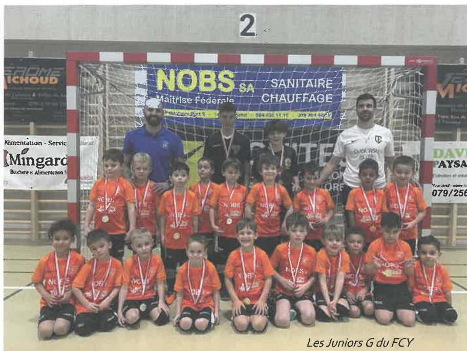
Les Juniors G du FCY

nous a raconté qu'il a commencé sa carrière professionnelle à Arsenal en 2004, alors qu'il n'avait que 16 ans. Il y a joué jusqu'en 2014. Djourou a également été un pilier de l'équipe nationale suisse, avec laquelle il a accumulé 76 sélections entre 2006 et 2018. Il a participé à trois Coupes du Monde de la FIFA et à deux Championnats d'Europe de l'UEFA, apportant son expérience et sa solidité défensive à l'équipe.