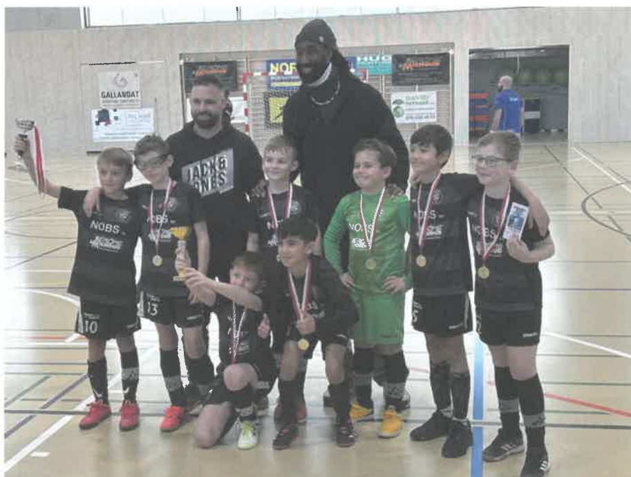
Les Juniors E1 et Johan Djourou

Ce week-end de football a été exceptionnel pour tous les enfants, qui ont pu vivre des moments de joie, de camaraderie et de sportivité. Félicitations à tous les participants et un grand merci aux organisateurs ainsi qu'à l'ensemble des bénévoles pour cet événement mémorable.