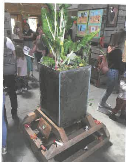
Grâce au bac transparent on peut voir les racines des plantes.