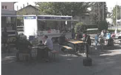
Espace petite restauration extérieur

La prochaine fois, on fera aussi le tri de ce qu'on utilise plus et on tiendra un stand. A l'année prochaine !