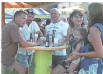
Ouvert aux petits et aux grands

(Article rédigé par A. Mancini, Secrétaire municipale adjointe de la Commune d'Yvonand)