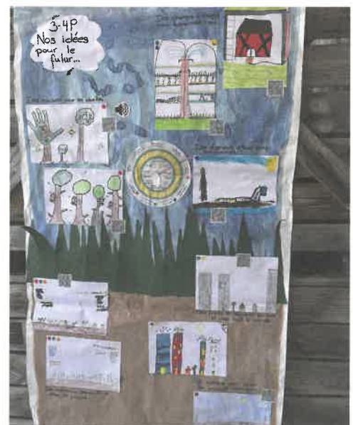
Quelques idées pour le futur.