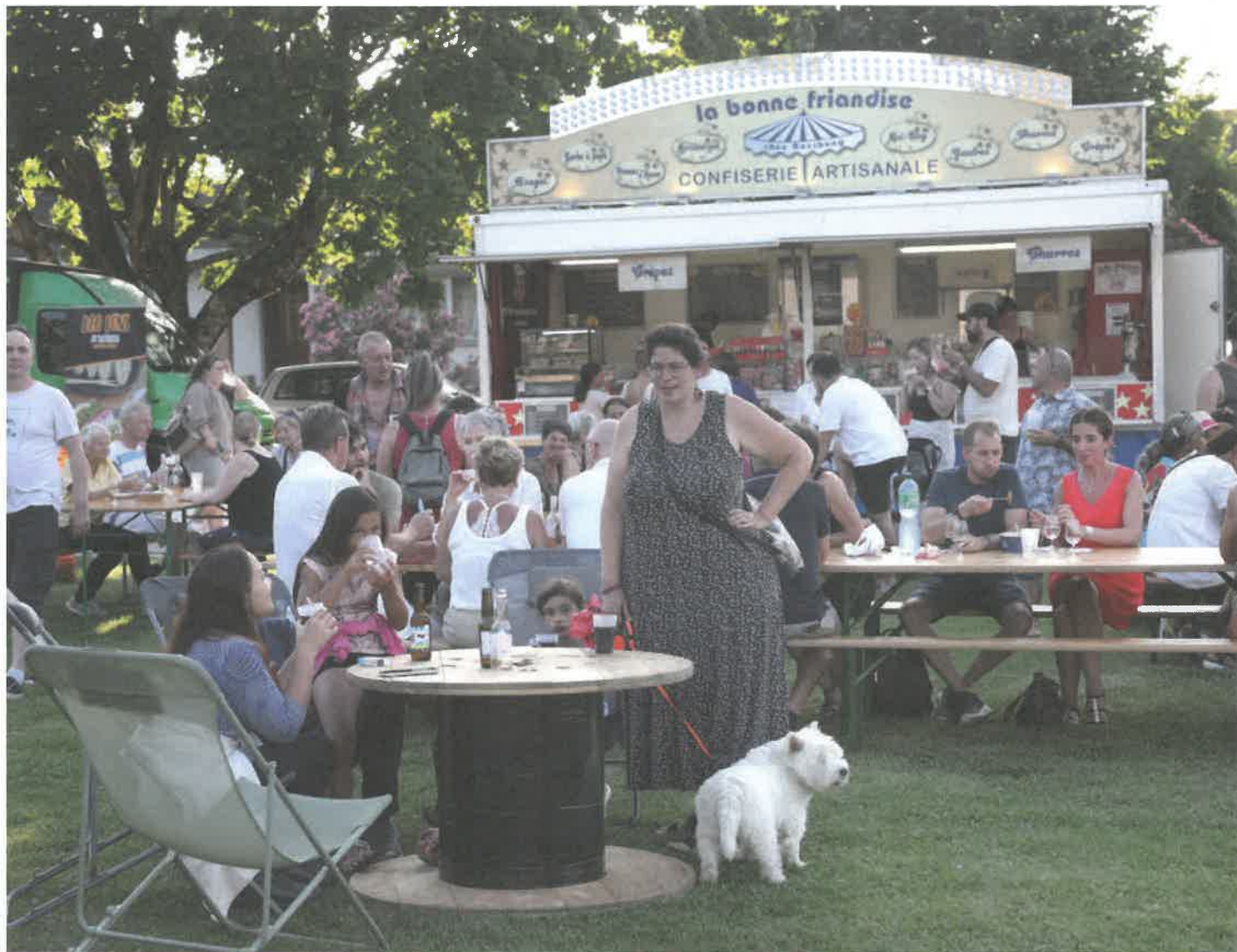
Le Mini Foodtruck Festival a rassemblé du monde sur le Pré de l'Hôtel de Ville vendredi 26 et samedi 27 juillet 2024