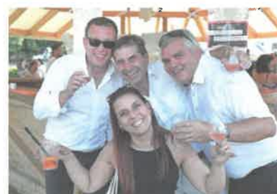
L'ambiance était à la fête tout l'été