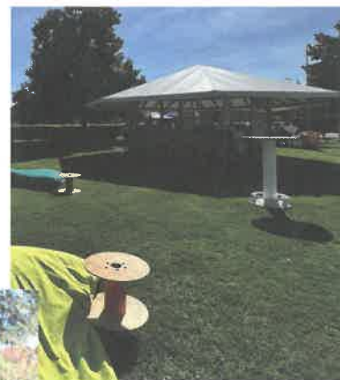
Une tonnelle et du mobilier d'été