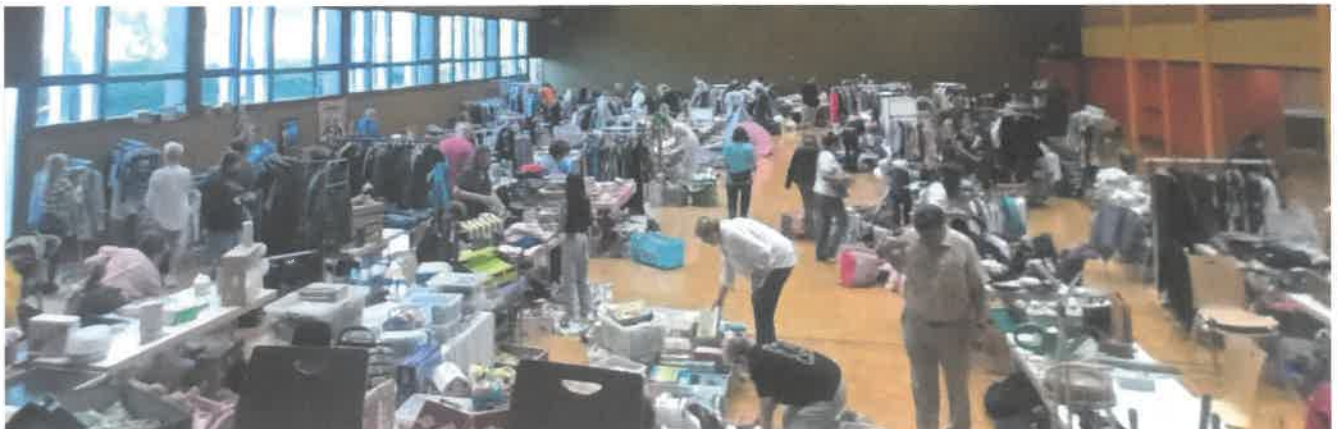
Les visiteurs pouvaient trouver facilement leur bonheur parmi tous les articles proposés