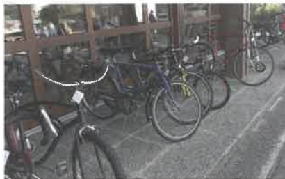
Bourse aux vélos