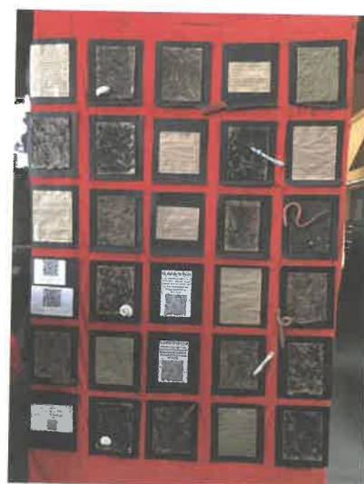
Différents sols : Les sols végétaux sont plus fertiles que les sols minéraux. Ces derniers ne sont formés que de débris de roche réduits en poudre.