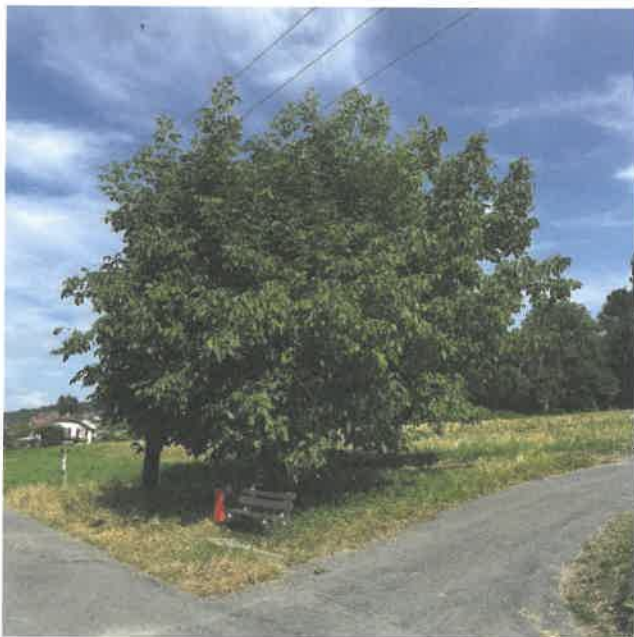
Noyer n° 46 en récolte libre à disposition des citoyens

Samedi 14 septembre, la commune d'Yvonand a célébré une nouvelle édition de la « mise de noix », une tradition qui remonte à plusieurs années. Cet événement villageois se déroule dans les vergers communaux, situés près du Pont des Îles, des Condémines, du Vallon des Vaux et de la rue l'Ancien Stand.