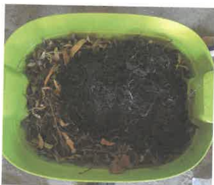
Les vers et leur précieux travail de transformation. Nous les avons nourri avec les déchets issus de nos récréations (trognons de pomme, peau de banane, épluchures...)